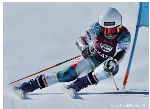
※イメージ写真の為、現物とは違います